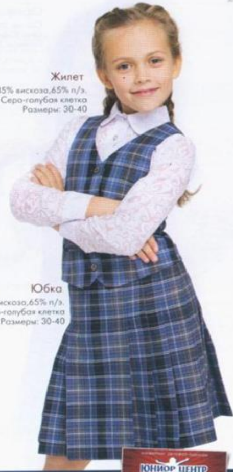
Жилет Состав: 35% вискоза, 65% п/э. Цвет: Серо-голубая клетка Размеры: 30-40