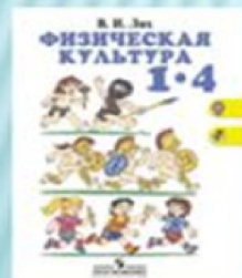
В. И Лях Физическая культура