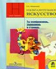
Неменская Л.А. Изобразительное искусство. Ты изображаешь, украшаешь и строишь