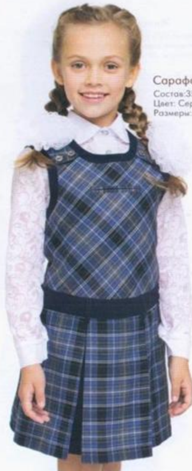
Сарафан Состав: 35% вискоза, 65% п/э. Цвет: Серо-голубая клетка Размеры: 28-40