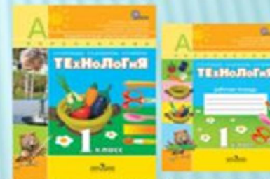
Роговцева Н. И., Богданова Н. В., Технология: Учебник 1 класс, рабочая тетрадь