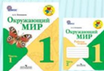
А.А. Плешаков «Окружающий мир»