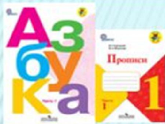
Горецкий В.Г., Азбука Федосова Н.А, Прописи