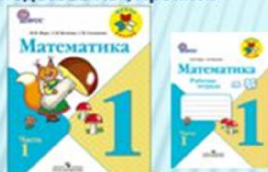
М.И. Моро «Математика»