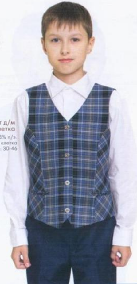
Жилет д/м Серо-голубая клетка Состав: 35% вискоза, 65% п/э. Цвет: Серо-голубая клетка Размеры: 30-46