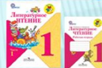
Литературное чтение: Учебник: 1 класс: В 2 ч., рабочая тетрадь Климанова, Горецкий, Голованова