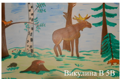
Викулина В 5В